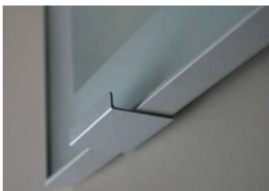
ΠΟΜΟΛΟ FLP05 ΚΟΛΛΗΤΟ